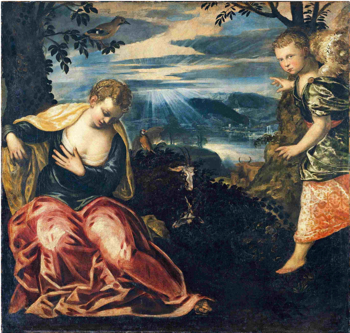
Le Tintoret (1519-1594), L'annonce à la femme de Manoah (vers 1557, huile sur toile, 150 x 155 cm), Musée Thyssen-Bornemisza, Madrid (Espagne).