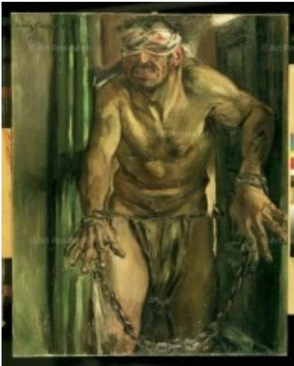
Lovis Corinth, Samson aveugle, 1912, Berlin.