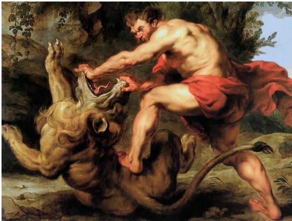
Rubens, Samson tue le lion, peinture sur toile, 1628, Madrid, Collection Villar-Mir.

On s'attend à ce que Samson commence maintenant sa mission de libération. Mais le texte réserve des surprises aux lecteurs. Est-ce l'Esprit de Yahvé qui le pousse dans une tout autre direction ? Le chapitre est entrecoupé par un même refrain : quelqu'un « descendit à Timna » et « chez une femme ». On peut ainsi distinguer trois descentes : première descente : Samson descend à Timna et voit la femme (v. 1-4) ; deuxième descente : Samson et ses parents descendent à Timna, et Samson descend chez la femme (v. 5-6.7-9) ; troisième descente : le père descend chez la femme (v. 10-20).