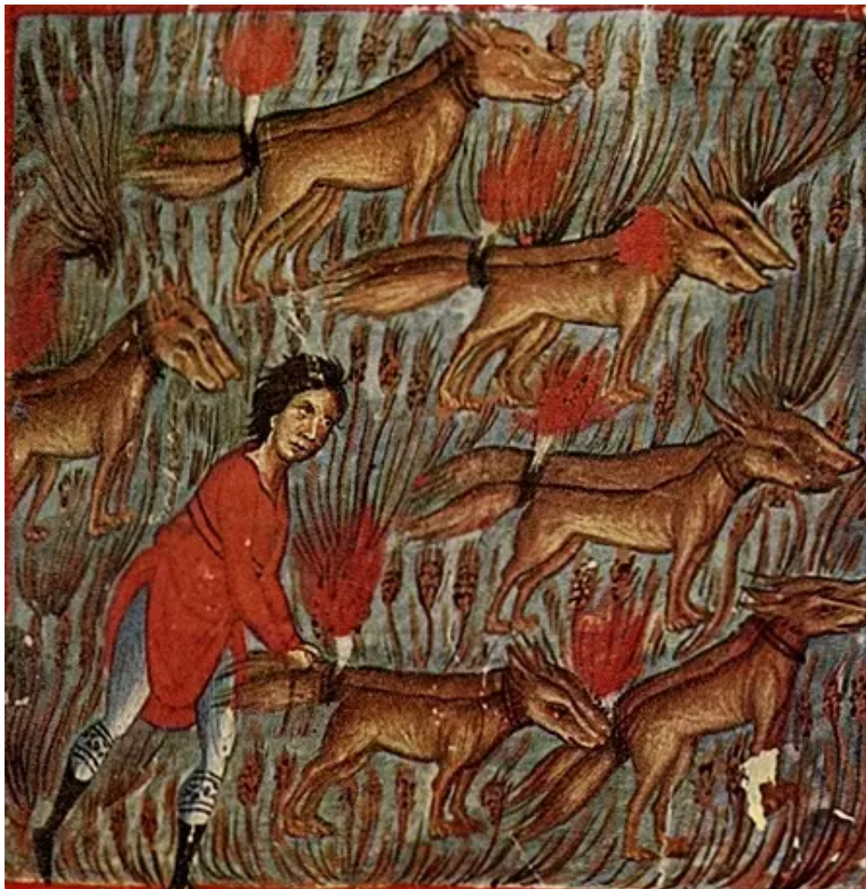
Artiste inconnu, Samson et les renards (miniature extraite d'un manuscrit du XIIIe siècle), Monastère de Vatopedi, Mont Athos (Grèce).