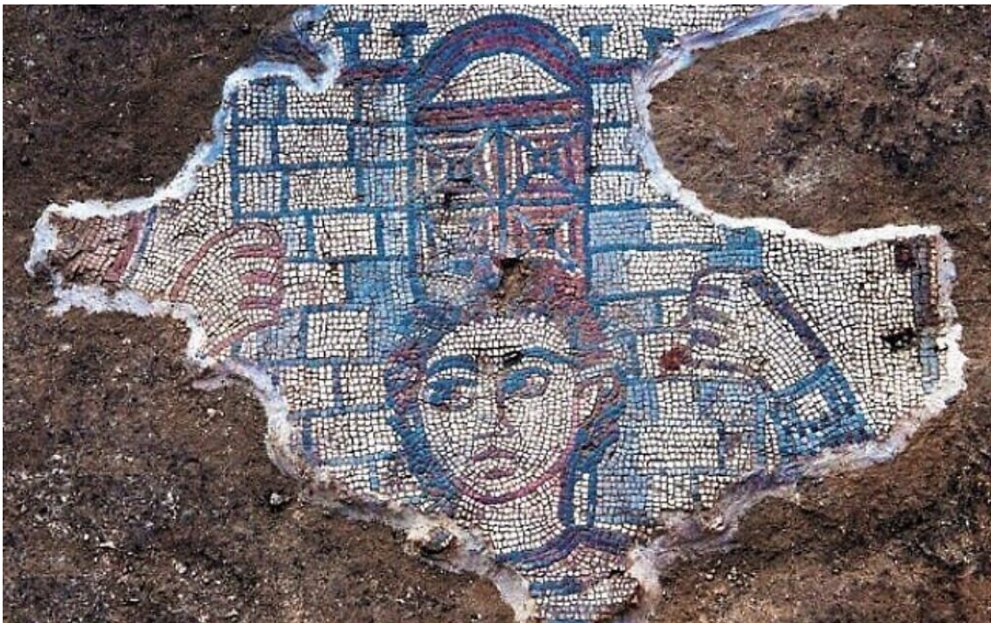
Mosaïque de Samson portant les portes de Gaza sur ses épaules, Synagogue de Huqoq, Israël, 5 e s.

Samson refait les mêmes actions, et les mêmes bêtises, qu'auparavant mais dans un ordre inversé, comme il ressort clairement de la structure chiasmique concentrique de toute l'histoire. À la visite de sa femme à Timna (15,1-8) correspond maintenant la visite de Samson à une prostituée de Gaza