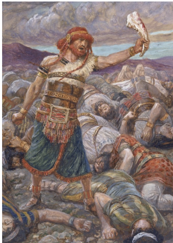
Jacques Joseph Tissot, Samson et la mâchoire d'âne, Musée juif, New York, 1896-1902.

Les événements précédents se sont déroulés autour de Timna (14,1-15,8). L'action se déplace maintenant vers Juda, à Léhi. L'histoire peut être divisée en trois sections. La première sert de préparation aux deux autres et chacune finit par un nom donné à l'endroit où a lieu l'événement. - Samson est ligoté (vv. 9-13) - Victoire de Samson avec une mâchoire (vv. 14-17) - Samson meurt de soif (vv. 18-19) [Conclusion : (v. 20)]