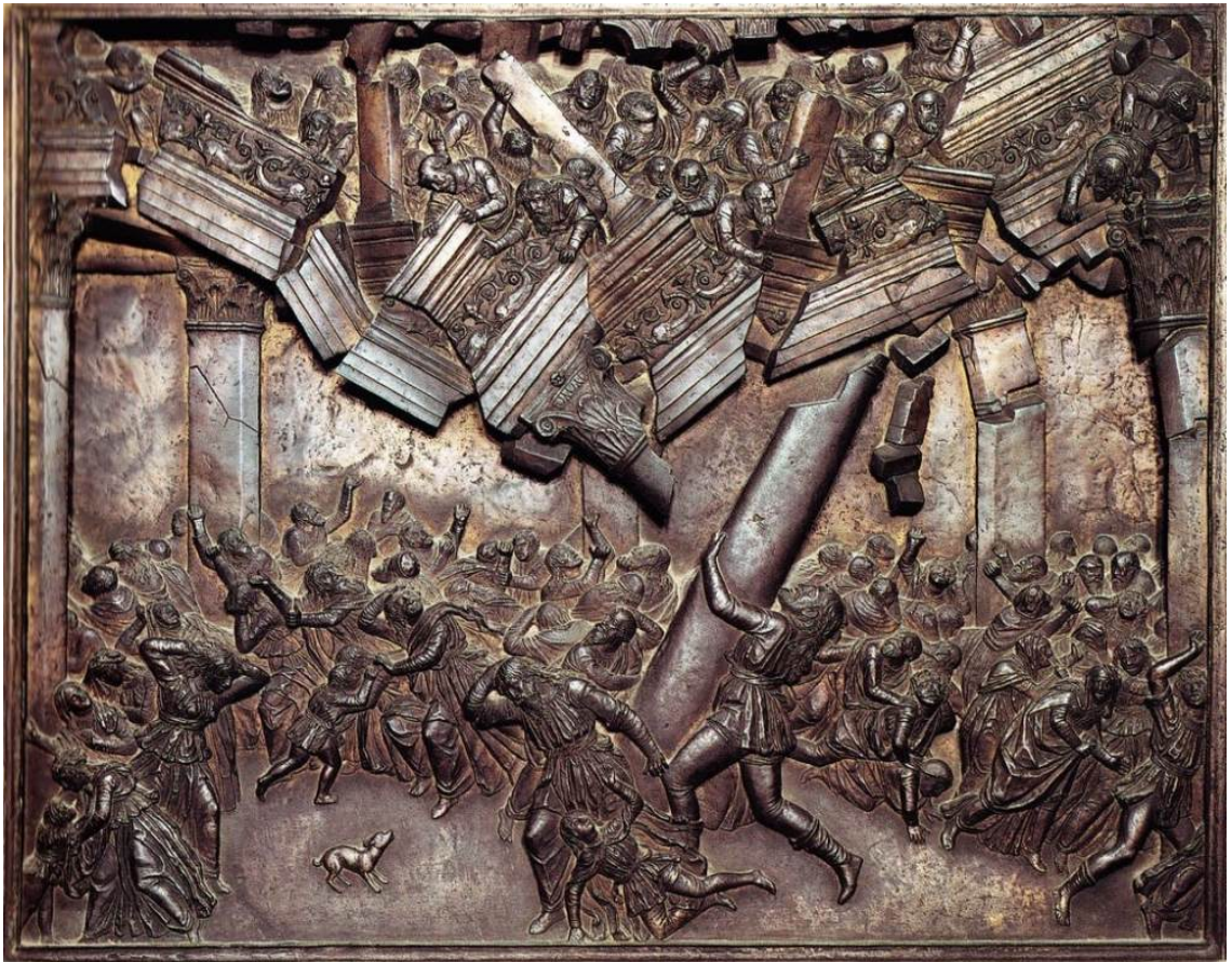
Bartolommeo Bellano, Samson détruit le temple des Philistins (1484-90), Bronze, Basilique de Sant'Antonio, Padoue.