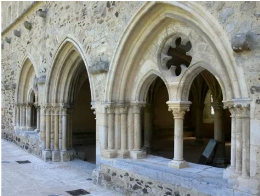
Abbaye cistercienne de l'Épau (Sarthe)