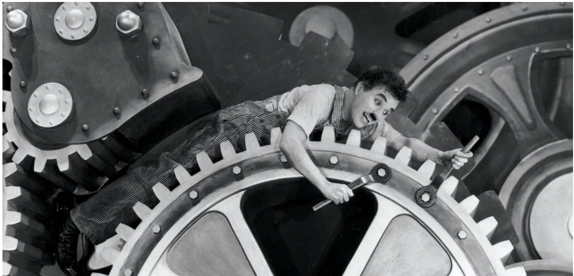
Chaplin, Modern Times (1936)