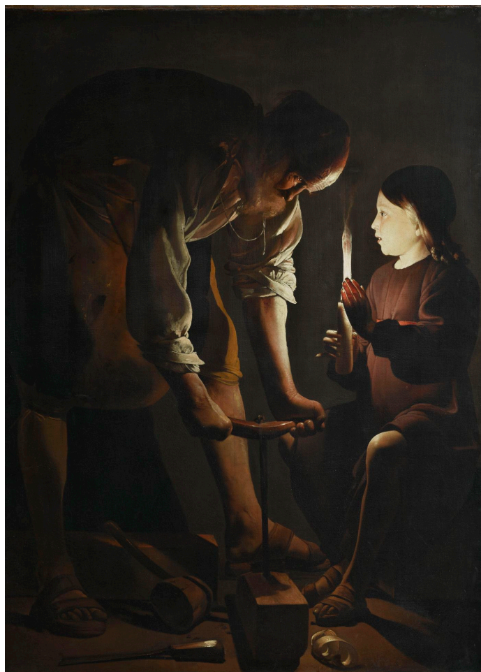
Saint Joseph charpentier (1642), Georges de La Tour (analyse)