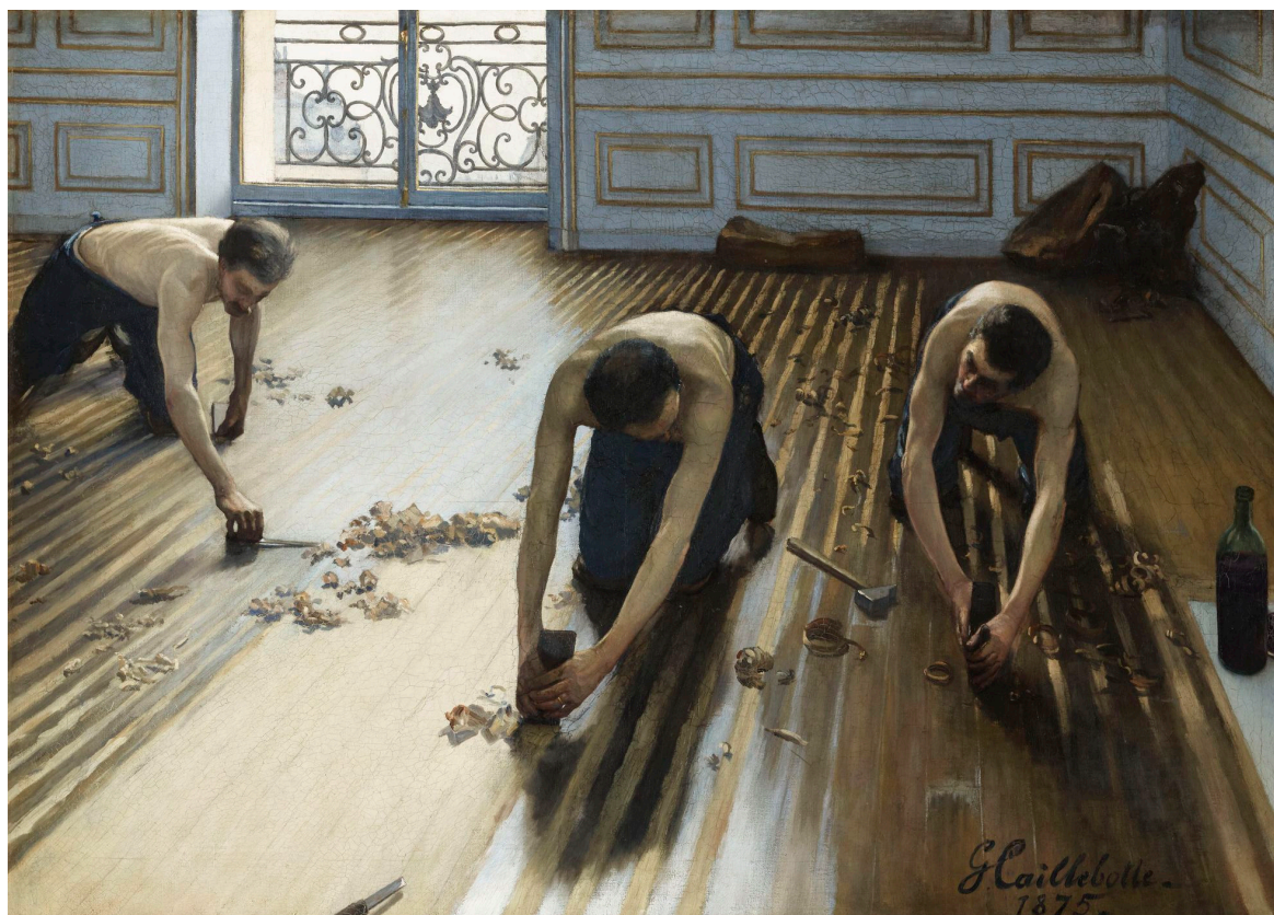
Gustave Caillebotte (1875), Les raboteurs de parquet.