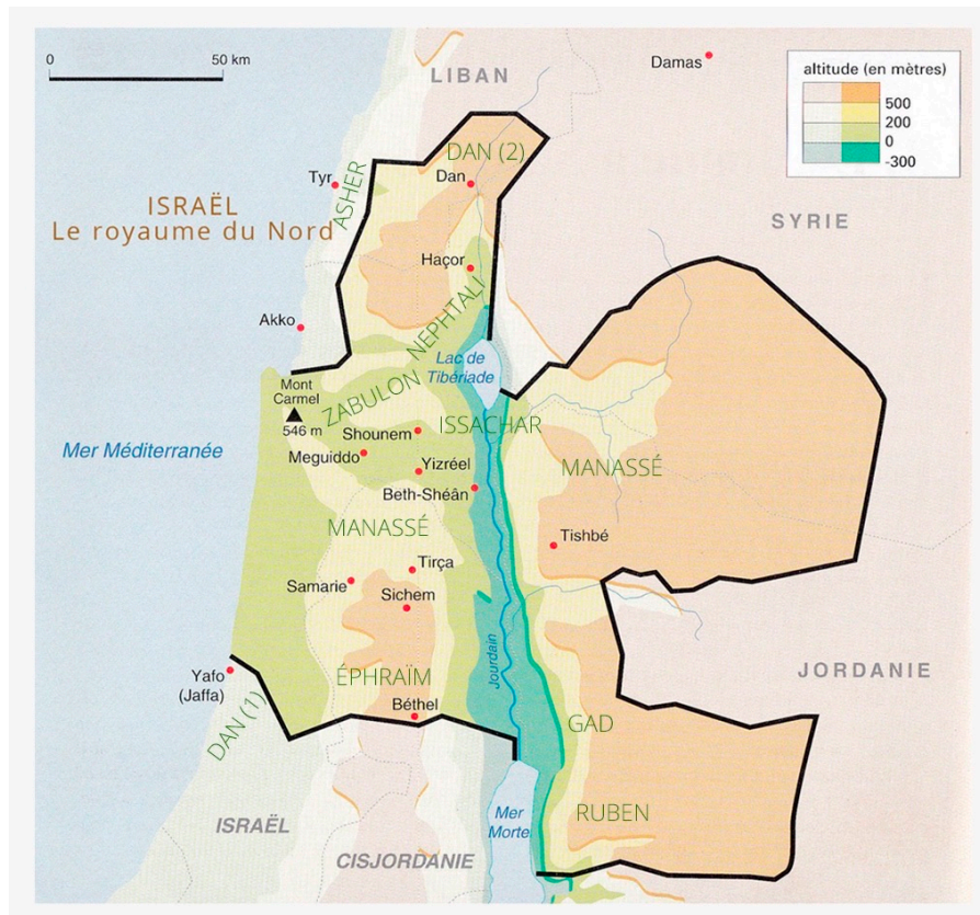
Carte du royaume du Nord (Samarie) © archeobiblion.fr