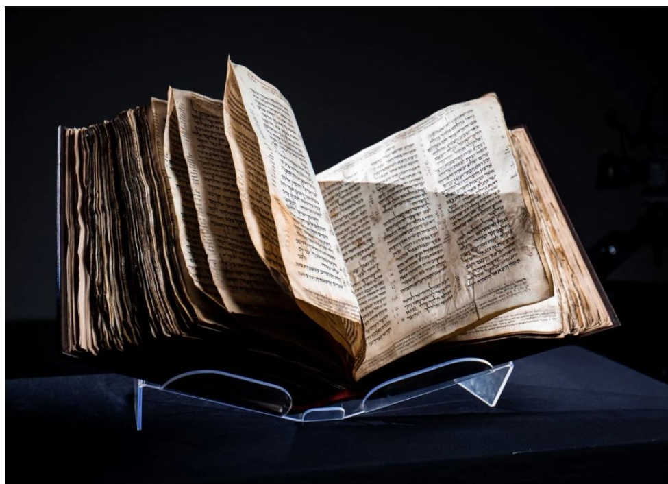
Codex Sassoon : la plus vieille Bible hébraïque. Le manuscrit date de la fin du IXe ou du début du Xe siècle