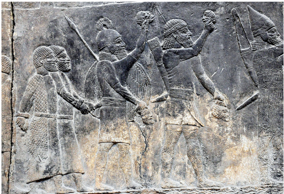
Des soldats assyriens amassant du butin et des têtes de vaincus. Palais Nord de Ninive.