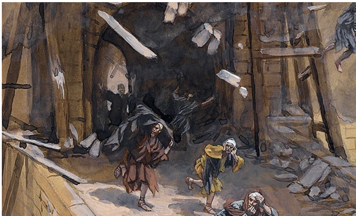
Écroulement de la Tour de Siloé

Pourquoi la Bible comprend-t-elle le mal constamment comme un châtement divin ? C'est une interprétation TROP FACILE, et ce n'est pas si simple. Jésus lui-même a dû se prononcer sur cette question épineuse du péché, de la rétribution, de la responsabilité de l'homme, et de la patience de Dieu. Voici un passage de l'Évangile de Luc 9 qui nous servira de guide sur un chemin de crête. JÉSUS REVISITE LES INTERPRÉTATIONS THÉOLOGIQUES ERRONÉES.