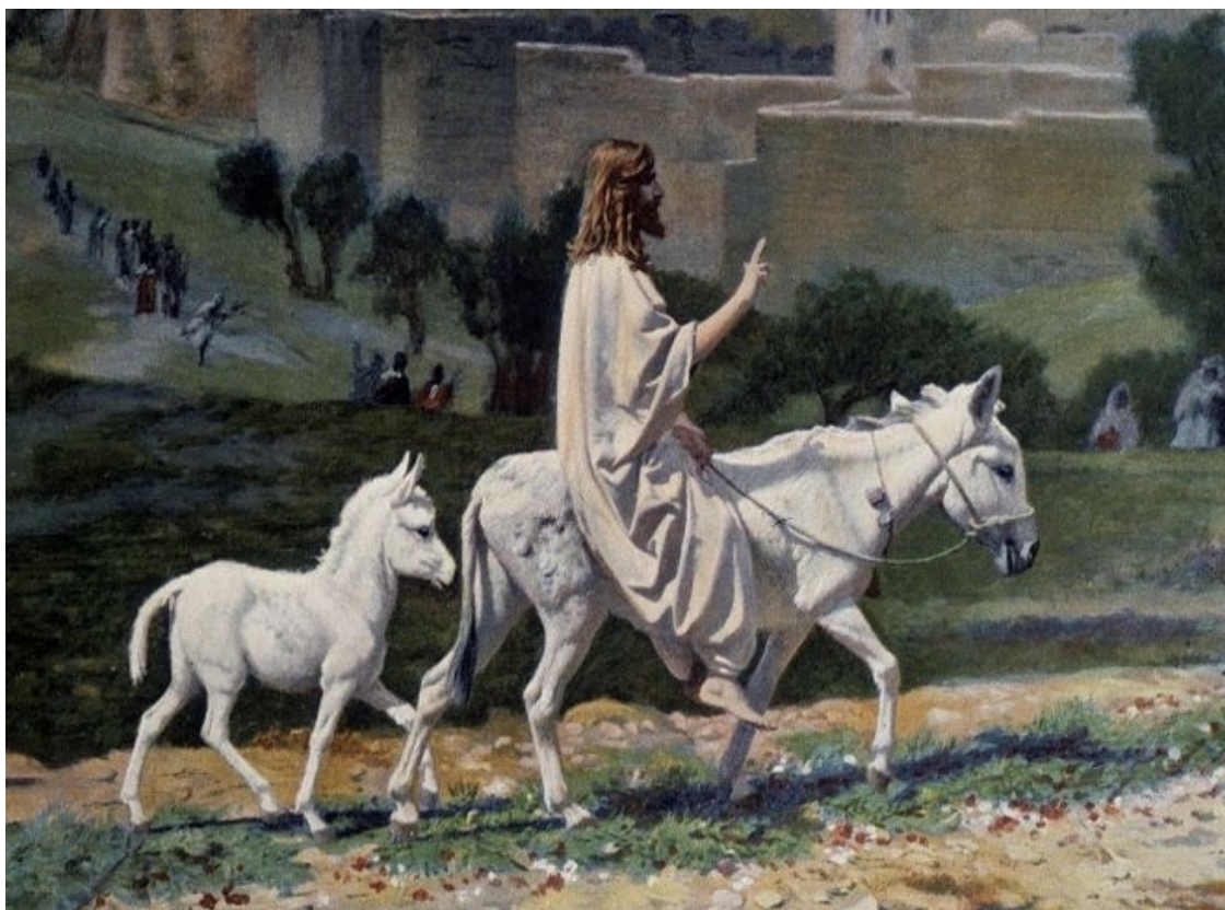
Entrée du Christ a Jérusalem le jour des Rameaux, gravure d'après une peinture de Jean-Léon Gérôme, fin du 19e siècle.