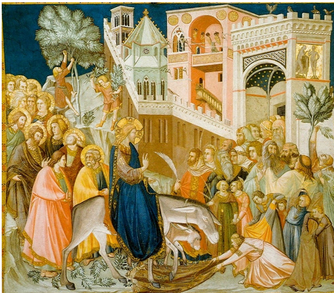
Pietro Lorenzetti (1280-1348), Arrivée du Christ à Jérusalem (1320), Basilique Saint-François, transept sud, Assise, Italie. Domaine public