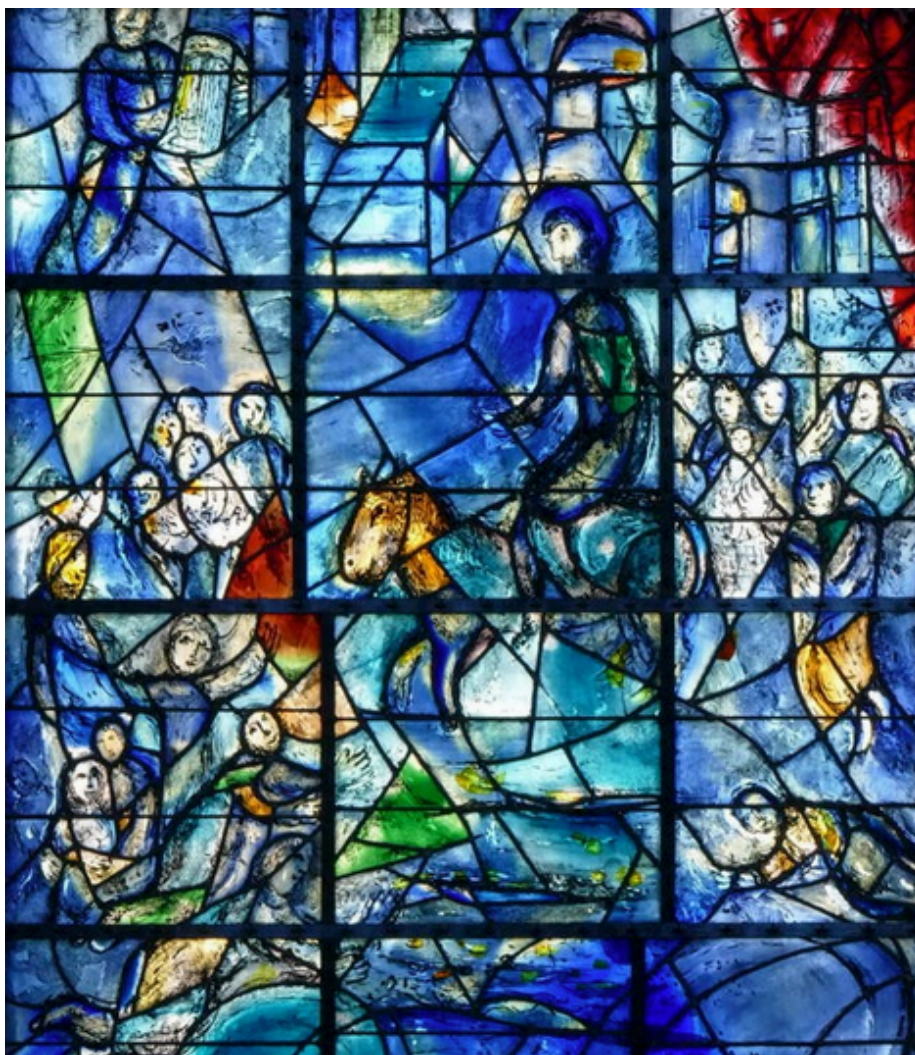
Chagall. L'entrée de Jésus à Jérusalem (1976). Chagall a évoqué la figure du Roi David au-dessus de cette scène évangélique (en haut, au coin gauche). Il chante et joue de la harpe. Nous savons que David est l'une des figures préférées de Chagall.