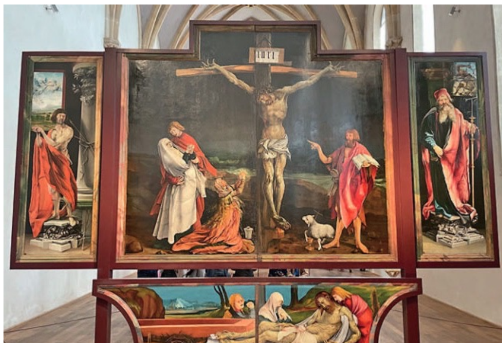
Rétable d'Issenheim, Musée Unterlinden, Colmar

Par " prophètes ", la foi de l'Église entend ici tous ceux que l'Esprit Saint a inspirés dans la vivante annonce et dans la rédaction des livres saints, tant de l'Ancien que du Nouveau Testament. La tradition juive distingue la Loi (les cinq premiers livres ou Pentateuque), les Prophètes (nos livres dits historiques et prophétiques) et les Écrits (surtout sapientiels, en particulier les Psaumes) (cf. Lc 24, 44).