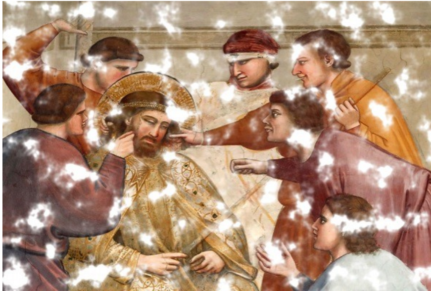
Giotto, les outrages

Dans l' Ancien Testament et la vie du peuple d'Israël, « messie » est annoncé et se voit plutôt relié à trois figures distinctes.