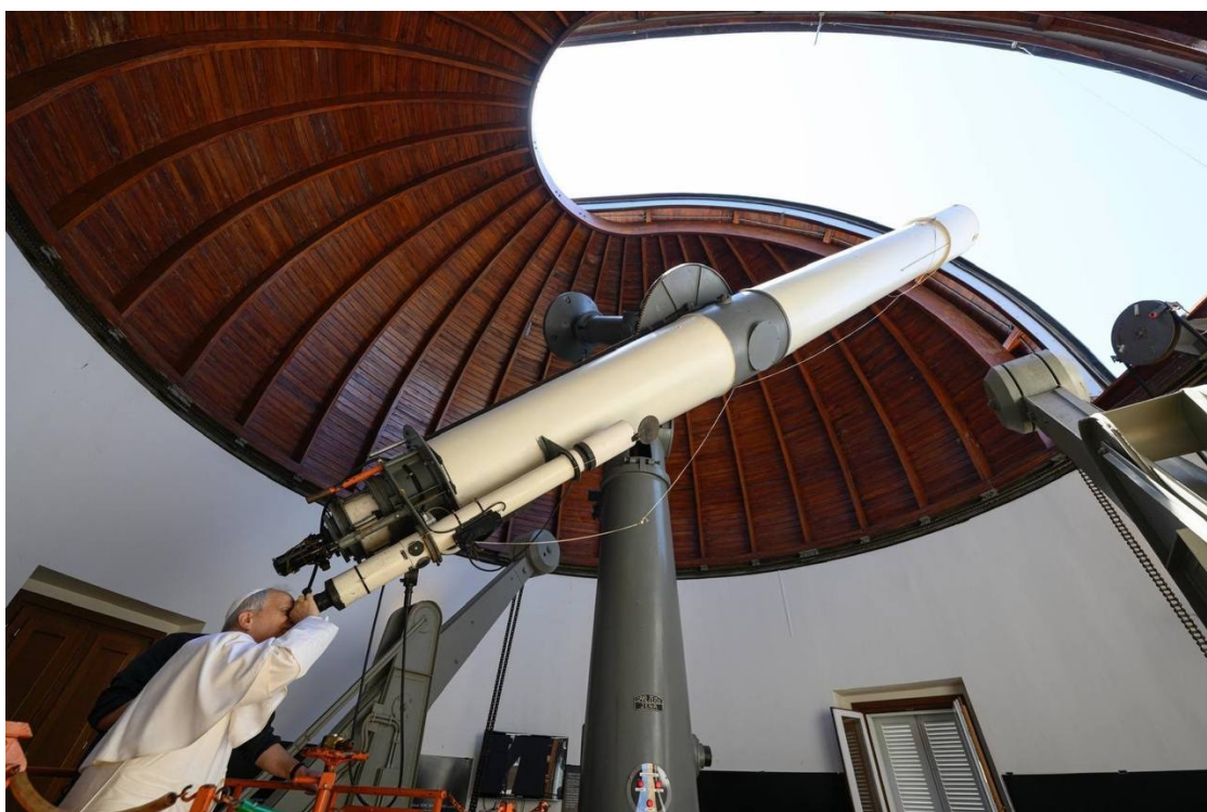
Le pape Léon XIV a visité les télescopes et les instruments installés dans les dômes de l'Observatoire du Vatican à Castel Gandolfo (20 juillet 2025)

Cependant, l'Ancien Testament est une approche progressive de la Révélation. Il annonce, préfigure, mais l'image, même si elle se précise est quelque peu lointaine.